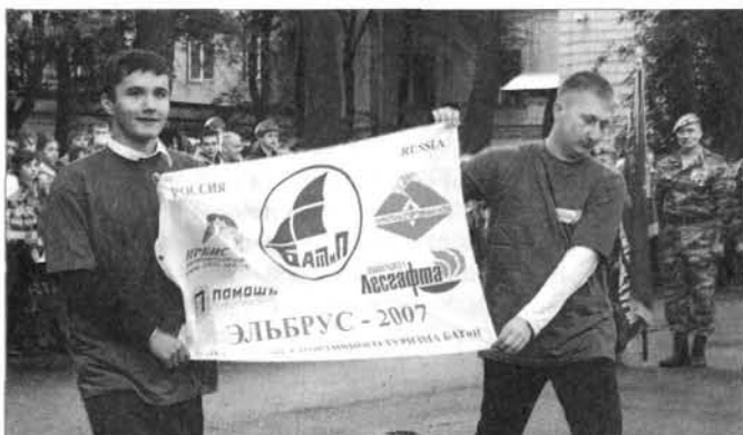
флаг с символикой СПб ГУФК им. П.Ф.Лесгафта, установленный на вершине Эльбруса представителями кафедры МФОРИТ