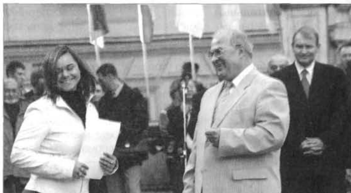
Вручение грамот за активное участие в общественной жизни университета