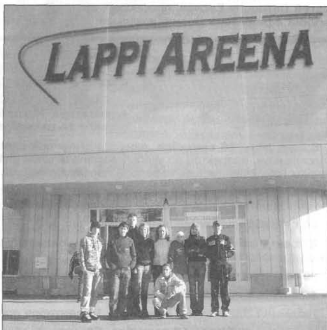
Студенты СПб ГУФК в Финляндии

Мончегорский филиал СПб ГУФК им. П.Ф. Лесгафта