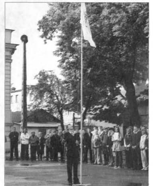
Торжественное поднятие флага СПб ГУФК им. П.Ф.Лесгафта