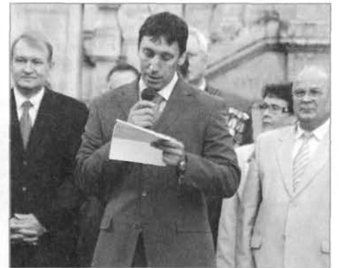
В.Н.Горохов, помощник члена Совета Федерации ФС России В.Л.Мутко