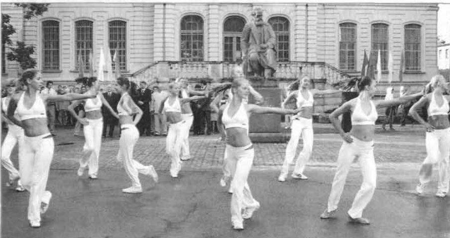
Яркое выступление студенток кафедры ТиМ гимнастики