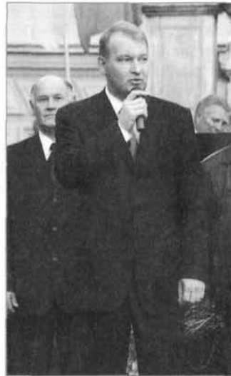
Председатель Комитета по физической культуре и спорту Правительства СПб В.В.Чазов