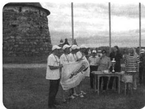
Награждение экипажа «Браво»

Гонка №3 от Соловков до о. Сосновец началась также со штиля, в середине этапа подул ветер штормовой силы. Все яхты 4-й группы из-за различных поломок рангоута вернулись в гавань Благополучия. «Белая ночь» финишировала 3-ми в группе, «Браво» 2-ми в 5-й группе. На берегу был организован праздник с пос-