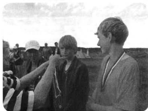
Награждение экипажа «Белой ночи»

чины гоночного балла. Яхта «Белая ночь» выступала в третьей стартовой группе (с гоночным баллом