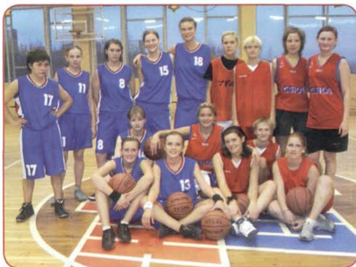
Женские сборные команды Северного колледжа и Мончегорского филиала

В турнире принимали участие команды юношей и девушек СКФКиС,