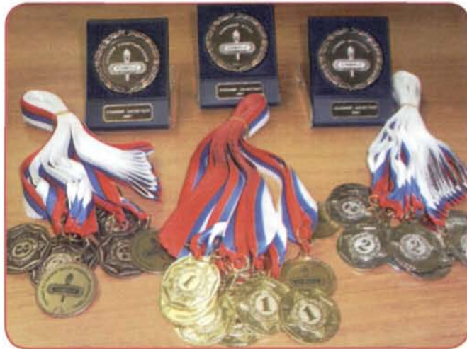
Награды предоставила администрация СКФКиС

С 8 по 15 октября на базе Северного колледжа физической культуры и спорта (СКФКиС) состоялся традиционный турнир молодежных команд города «Осенний баскетбол», которым открылся очередной баскетбольный сезон в городе.