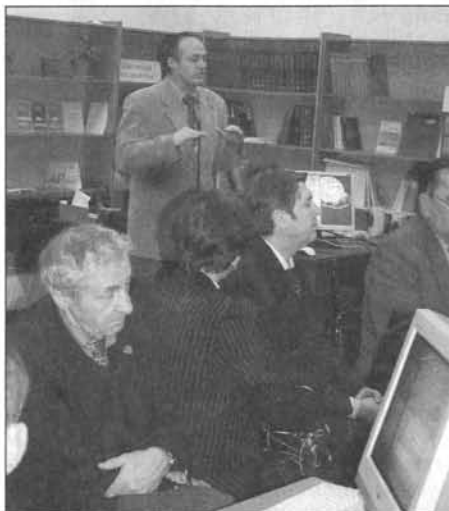
Презентация в библиотеке.