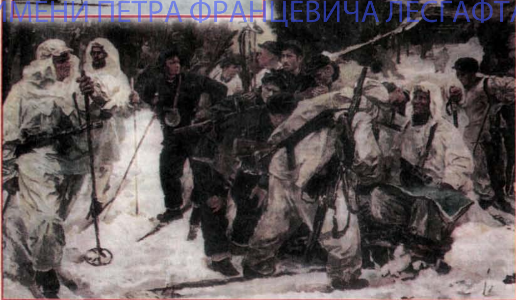
И.А. Серебряный «Партизаны-лесгафтовцы после боевой операции», 1942 год.

27 января – День снятия блокады Ленинграда. В этот день 64 года назад была полностью снята 900-дневная блокада города. В ознаменование подвига ленинградцев-воинов и тружеников тыла наш город был удостоен звания ГОРОД-ГЕРОЙ. Лесгафтовцы навечно вписали в скрижали истории вуза имена преподавателей, сотрудников, студентов, которые отстаивали нашу с вами возможность учить и учиться в стенах родного университета. Вечная им память и слава!