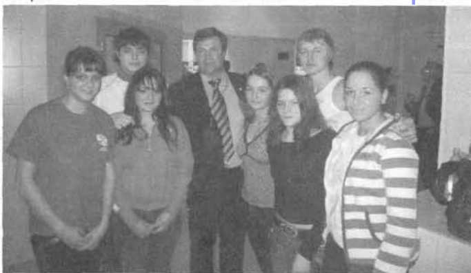
Студенты кафедры ТИМ плавания с четырехкратным чемпионом Олимпийских игр В. Сальниковым (в центре)