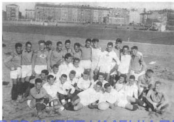
Участники показательной игры в регби между студентами тренерского и педагогического факультетов института. 1934 год

В истории развития регби в институте-академии-университете физической культуры им. П.Ф.Лесгафта можно