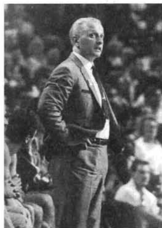
Александр Яковлевич Гомельский

10 января в Кронштадте вспомнили А.Я. Гомельского. На доме, где он родился, открыли мемориальную доску. Почтить память великого спорт-