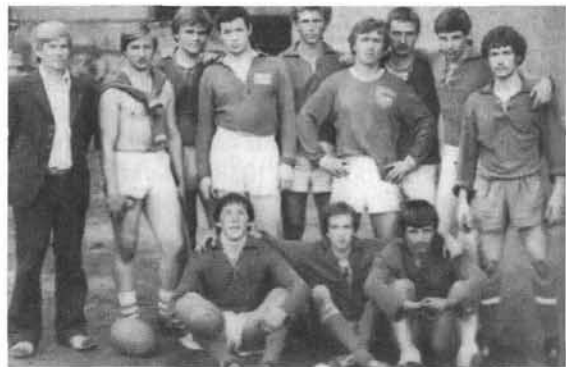
Сборная команда СКИФ образца 1982 года

этап начался в 1975 году с преподавания автором этой работы ознакомительного курса регби для студентов специализирующихся по спортивным играм.