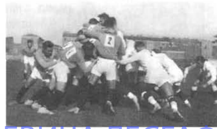
Момент схватки в игре. 1934 год

Однако официальных соревнований не проводилось, а в 1910 году в Санкт-Петербурге вышла