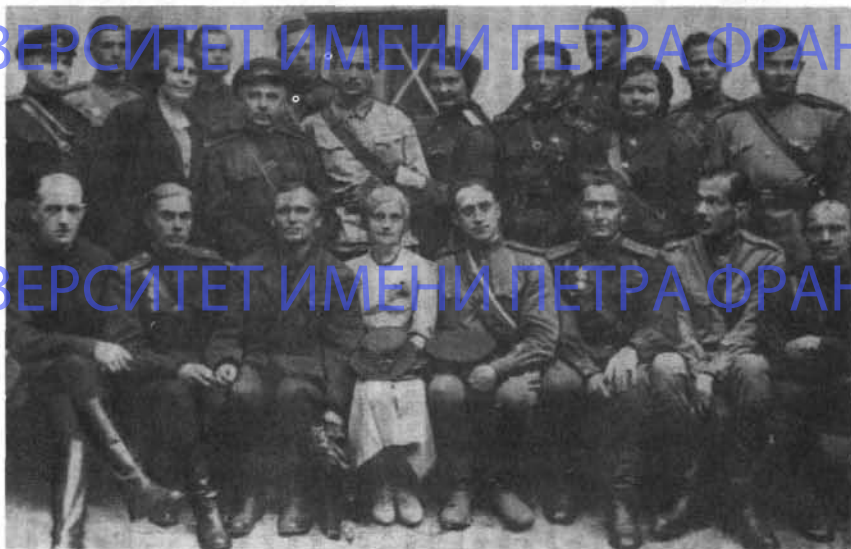
Участники слета лесгафтовцев-фронтовиков (9 июля 1943 года)

влажно расплывалось пунцовое пятно. «Нет, — словно кто-то другой, со стороны, сказал ей, а не сама она подумала об этом. — Не может быть, чтобы эти каннибалы победили. Победим мы. Мы еще предъявим им счет. За все. После победы. После нашей победы».