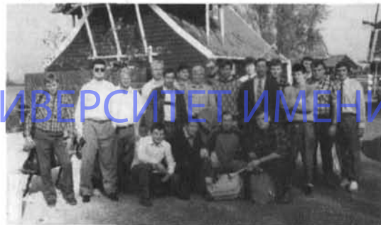
Турне команды СКИФ-ЛГУ по Голландии

Подводя итоги, хочется надеяться, что регби в НГУ им.П.Ф.Лесгафта, в Санкт-Петербурге и всей России ждет такое же большое будущее, как и во всем мире.