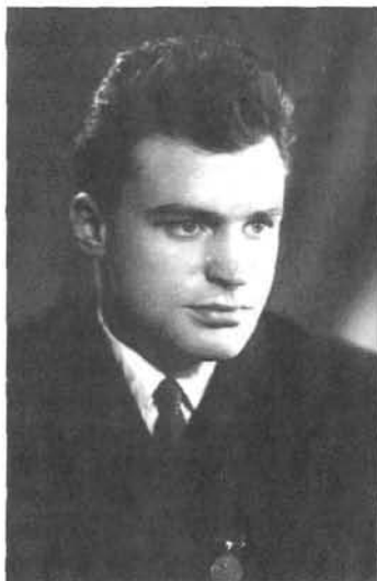
Геннадий Иванович Шатков

14 января в Санкт-Петербурге на 77-м году жизни скончался сильнейший боксер любительского мирового бокса второго среднего веса 1950-х годов, Олимпийский чемпион по боксу Геннадий Иванович Шатков.