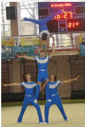
Юные гимнасты исполняют акробатический номер