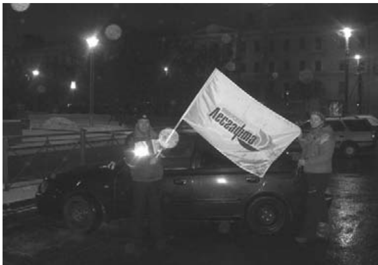
Участники автопробега с флагом университета