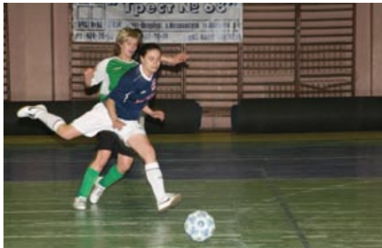
В атаке - футболистки «Искры»

Д атой рождения женской футбольной команды «Искра» является 1987 год. Тогда команда называлась «Скорход» (Ленинград). С тех пор клуб не раз менял название - «Интерленпром», «Циклон», «Сила». Это было связано с желанием спонсоров и необходимостью участвовать в играх Кубка и чемпионата СССР и России.