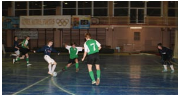
Через секунду мяч окажется в воротах соперника

Весной 2008 года мы выиграли Кубок России и получили право выступать в международном турнире