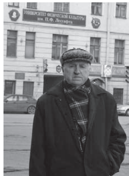
50 лет спустя, у стен родного вуза

зарубежные специалисты. Среди участников семинара был извест-