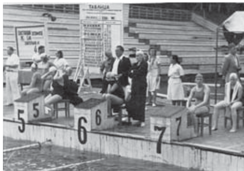
Команда Ленинграда на первенстве СССР. 1947 г.