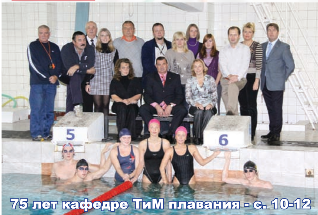
75 лет кафедре ТИМ плавания - с. 10-12

Из истории разви- тия художественной гимнастики - с. 4-5