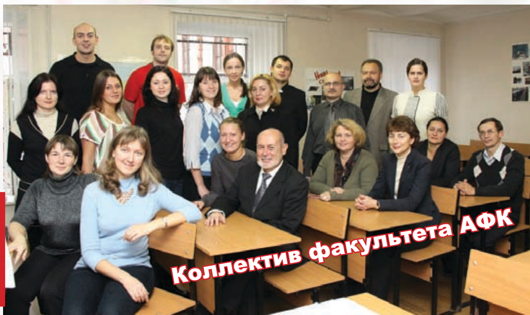
Коллектив факультета АФК

ФАКУЛЬТЕТУ АДАПТИВНОЙ ФИЗИЧЕСКОЙ КУЛЬТУРЫ - 10 ЛЕТ - с. 2-3