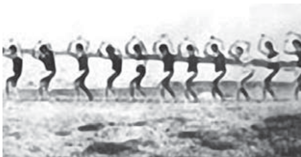
«Высшая школа художественного движения» при институте физической культуры им. П.Ф. Лесгафта. Ленинград. 1935 год

Первый период (1947-1963) характеризуется формированием художественной гимнастики как средства физического вос-