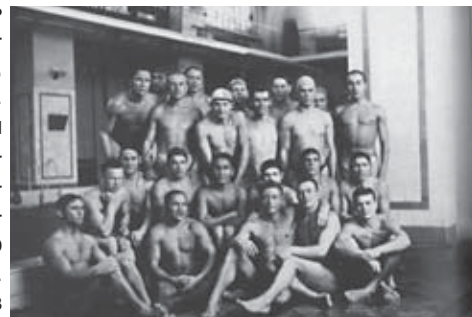
На занятиях в бассейне в 30-е годы

Шумин был одним из основоположников детского спортивно-