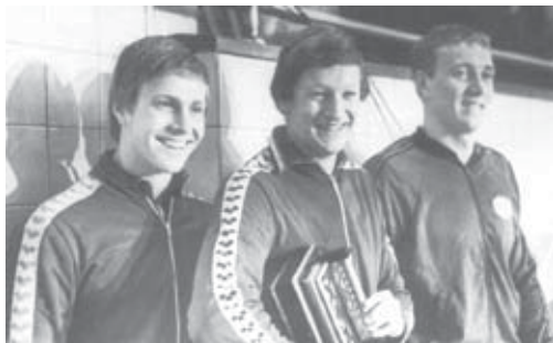
Олимпийские чемпионы В. Сальников, С. Русин, А. Крылов (слева направо)

Идут годы, и кафедра плавания достойно продолжает эстафету по-