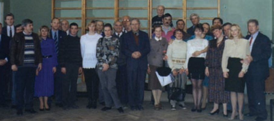
Сотрудники кафедры и университета в год 60-летия кафедры плавания

В 1982 году при кафедре создана ДЮСШ по синхронному плаванию, подготовившая ряд ведущих