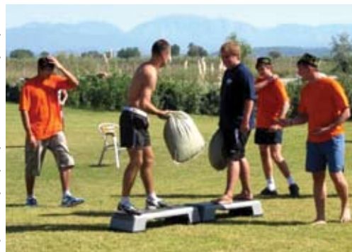
Соревнования на Сабантуе

Команда Санкт-Петербурга приобрела новых друзей, попробовала себя в самых разнообразных сценических ролях и амплуа, ощутила настоящий экстрим во время сплава по горной реке на рафтах, набралась сил и новых