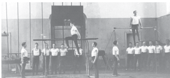
На уроке гимнастики в зале № 1. 1929 г.