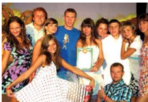
Лесгафтовцы – призеры киноконкурса

Хочется выразить особую благодарность всем организаторам слета и лично ректору НГУ им. П.Ф.