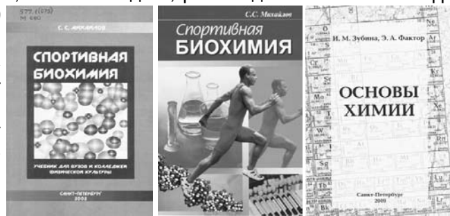
Учебники и учебные пособия, выпущенные кафедрой