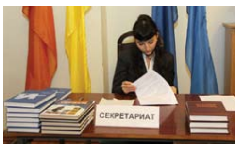
Секретариат с подарочными изданиями новых учебников по туризму

Международная научно-практическая конференция «Туризм и