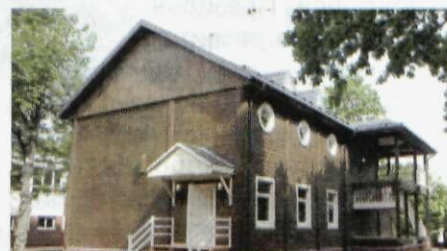
Английский клуб, открыт в 1864 г.

Также в рамках Президентской регаты состоялась презентация книг Стивена Редгрейва «Золотая эра» и трехкратного олимпийского чемпиона Вячеслава Иванова «Ветры олимпийских озер».