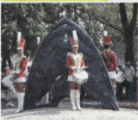
Открытие памятного знака «Россия – спортивная держава»

В течение всех дней Форума агентство «РИА-новости» проводило пресс-конференции с основными участниками мероприятия. Вице-премьер РФ А.Д. Жуков отметил, что сейчас спорт очень активно развивают в регионах. В самую спортивную десятку России входят Москва, Краснодарский край, Ростовская область, Якутия, Камчатский