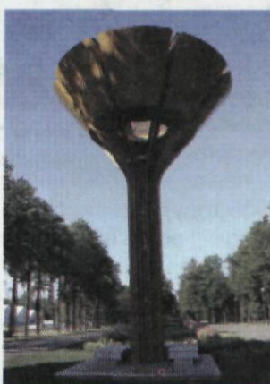
Факел московской Олимпиады

Большой праздник прошел на основной арене «Лужников» с участием выдающихся спортсменов – героев московских олимпийских игр, среди которых были, конечно, и лесгафтовцы.