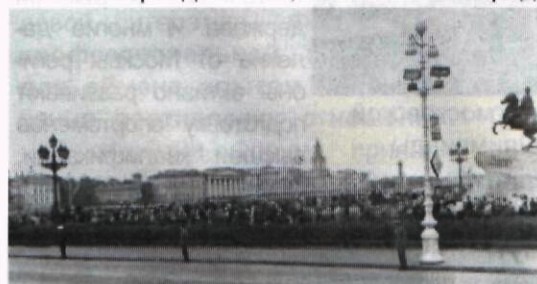
Посмотреть на пронос Олимпийского огня собрались тысячи жителей города

Обстановка в институте во время Олимпиады была такой же праздничной, как и на