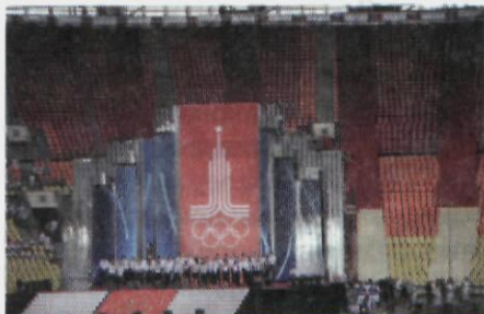
В Лужниках вспоминали Олимпиаду-80