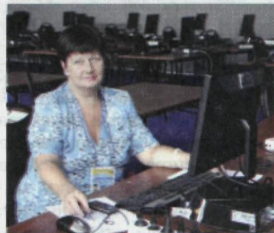
В пресс-центре форума

массовый спорт, строят спортивные олимпийские объекты.