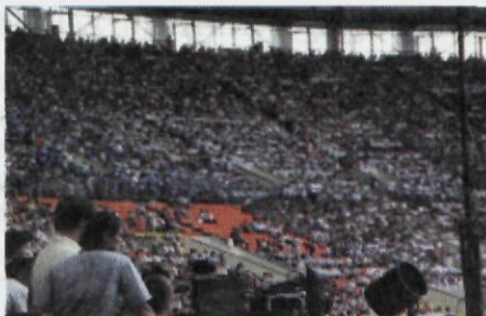
Переполненные трибуны московского стадиона