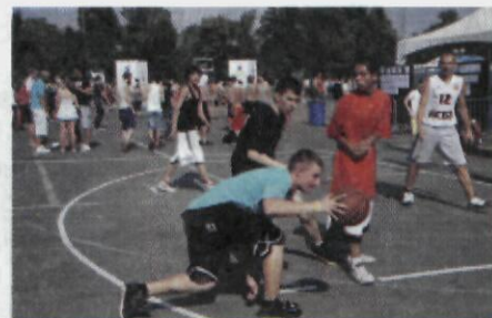
На всей территории большого парка спорткомплекса «Лужники» проходили турниры профессионалов и массовые соревнования для посетителей