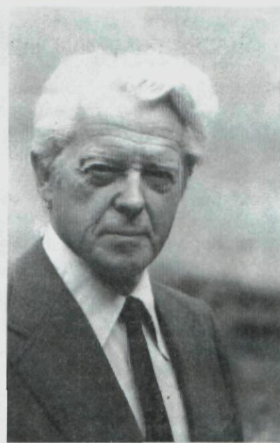
«Было бы таких людей побольше...»

Сейчас в большой спорт приходят руководители, которые требуют