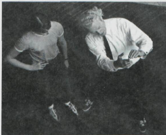
«Взаимопонимание с учеником – важнейшее качество педагога...»