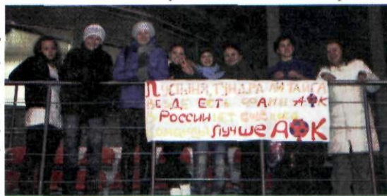
Лучшая поддержка — у ИАФК