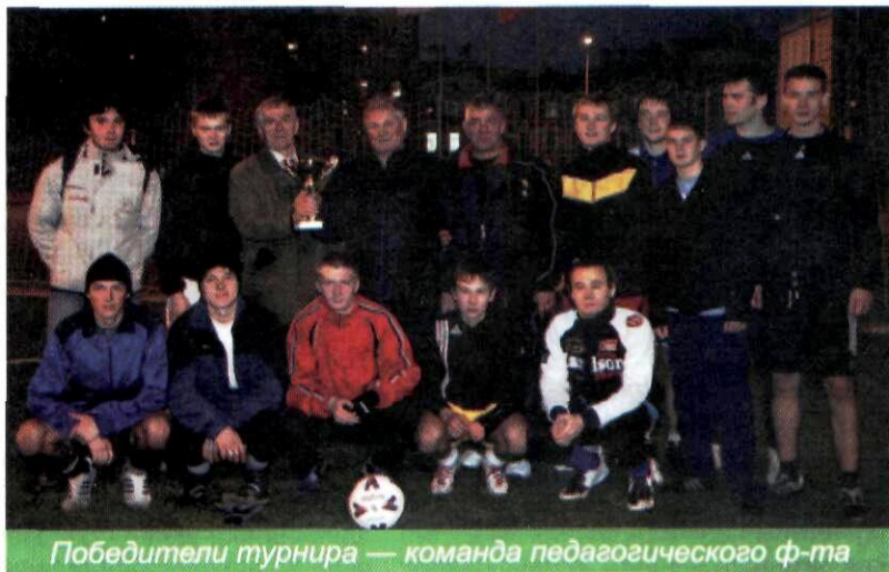
Победители турнира — команда педагогического ф-та