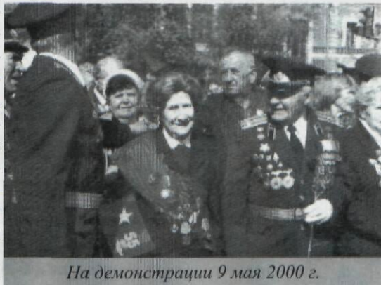
На демонстрации 9 мая 2000 г.

янную Коллегию по физической культуре и спорту города.