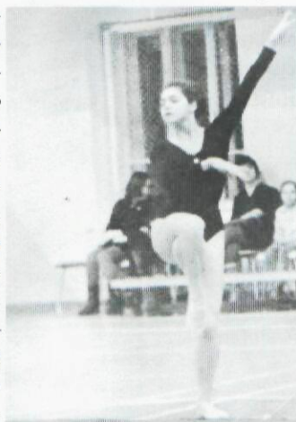
Художественная гимнастика — ее призвание