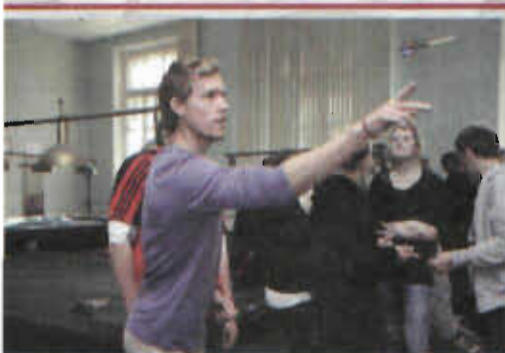
НАШИ ПЕРВОКУРСНИКИ И ГОСТИ ИЗ ДАНИИ ЗНАКОМЯТСЯ С ВУЗОМ