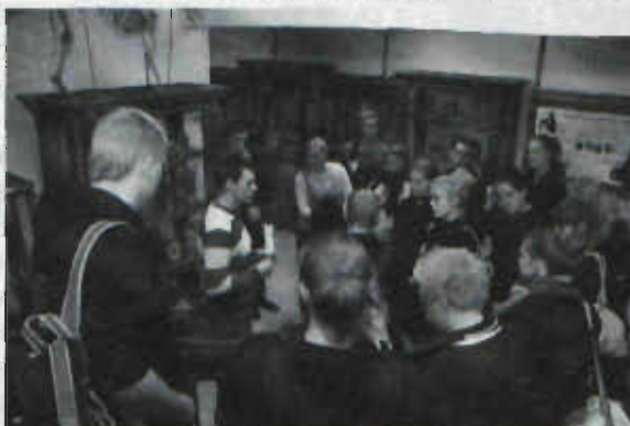
Датские студенты слушают рассказ об экспонатах музея кафедры анатомии

культета обзорных экскурсий по университету в рамках «Университетской недели» стало традицией, и является неотъемлемой частью учебной и воспитательной работы. Как известно, учебные планы целого ряда образовательных программ, реализуемых на факультете: «Социокультурный сервис и туризм», «Туризм», включают дисциплину «Экскурсионная и выста-