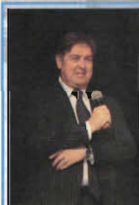
ПОСВЯЩЕНИЕ В СТУДЕНТЫ В ДМ «РЕКОРД» ПРИ ПОДДЕРЖКЕ Администрации Адмиралтейского района