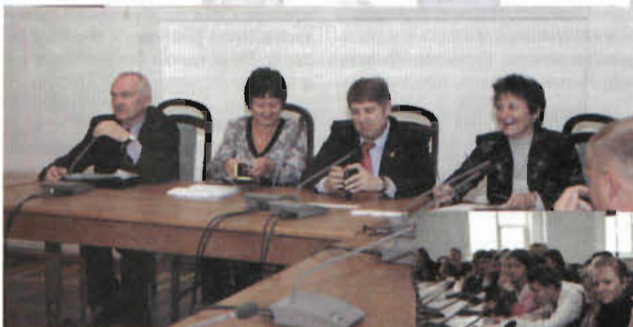
ОТКРЫТИЕ УНИВЕРСИТЕТСКОЙ НЕДЕЛИ