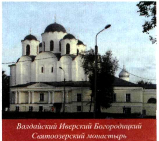
Валдайский Иверский Богородицкий Святоозерский монастырь

монастыря в 1654 году в Святое. Поразила погода, которая благоприятствовала при посещении монастыря. Среди палящей жары, сопровождавшей при посещении всех предшествующих исторических мест, внезапно нас окружила долгожданная прохлада, небо послало теплый дождь... После этого обратная дорога оказалась совсем неутраченной.