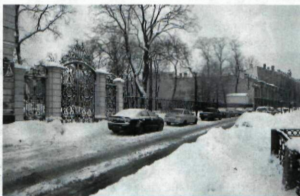
Почему бы к юбилею вуза не переименовать этот участок набережной Мойки?

улицы хоккеиста и футболиста, олимпийского чемпиона Всеволода Боброва, вратаря сборной страны по футболу Николая Соколова, фигуриста Александра Паншина.