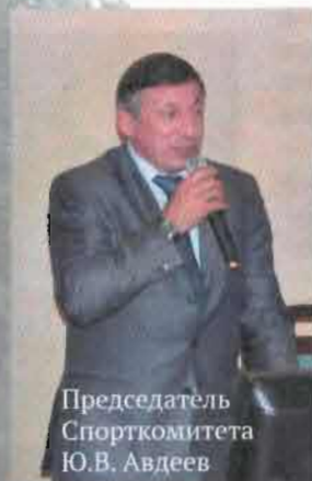
Председатель Спорткомитета Ю.В. Авдеев