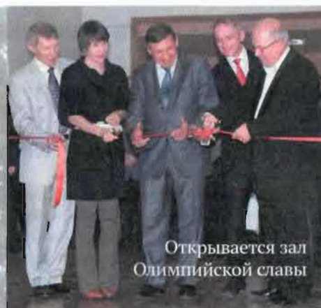
Открывается зал Олимпийской славы