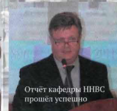
Отчёт кафедры ННВС прошёл успешно