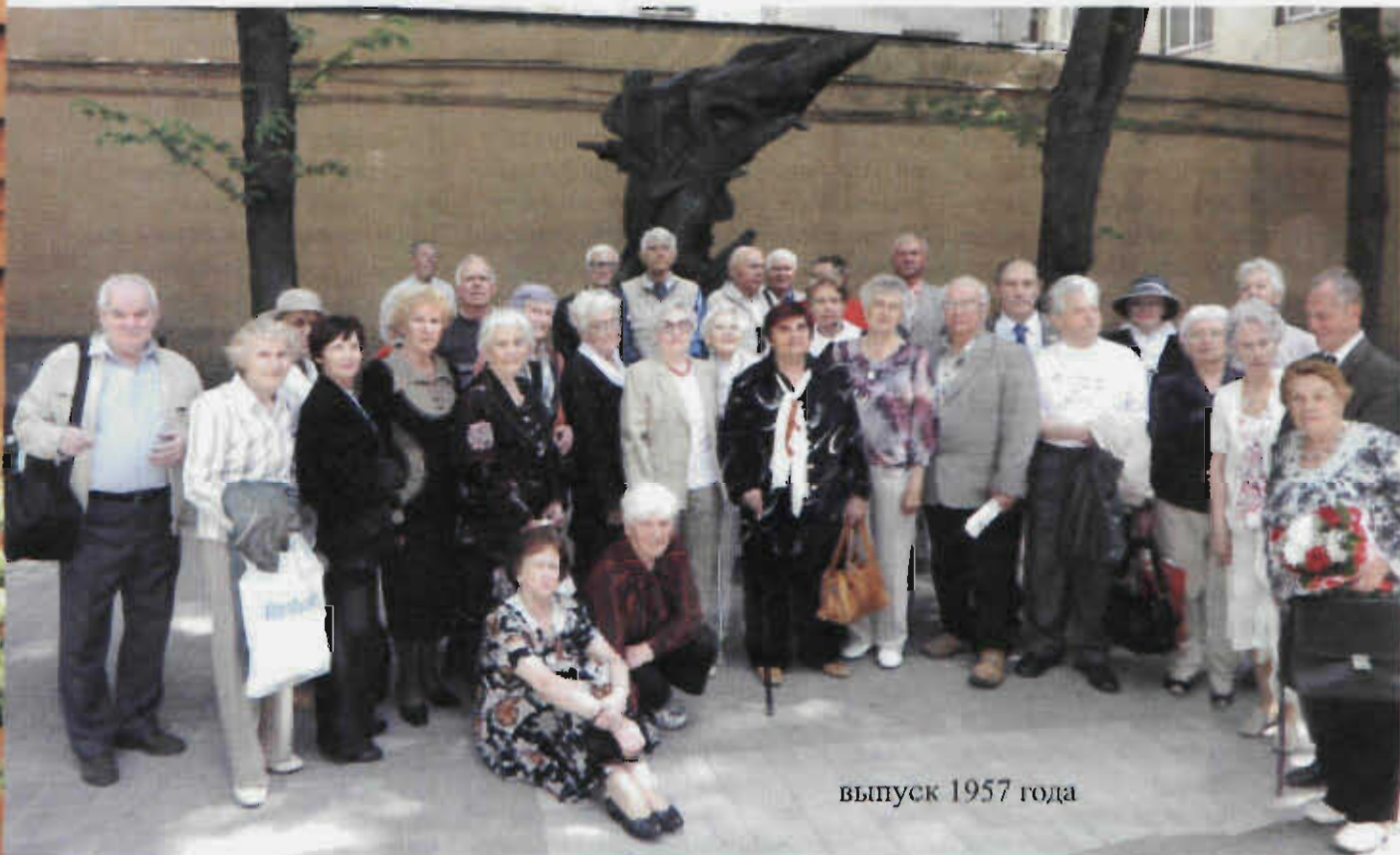
выпуск 1957 года

Одной из самых гуманистических традиций старейшего спортивного вуза России является организация регулярных встреч выпускников. И вот 25 мая 2012 года Актовый зал университета открыл свои двери тем, кто получал здесь дипломы 40 и 55 лет назад!