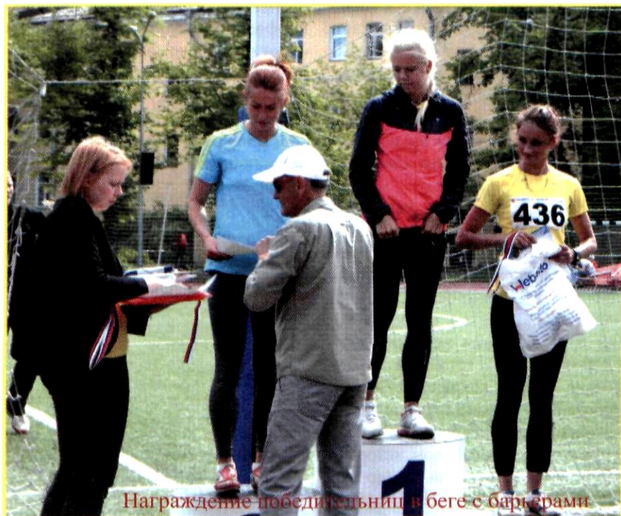
Награждение победителей в беге с барьерами

ст. преподаватель кафедры ТИМ легкой атлетики