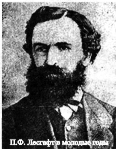
П.Ф. Лесгафт в молодые годы

Многие лучшие профессора Казанского университета, протестуя против увольнения талантливого и честного коллеги, подают прошение об отставке и покидают Казанский университет. Но для самого П.Ф. Лесгафта ситуация складывается в высшей степени сложная. Заработка нет, а надо содержать жену и