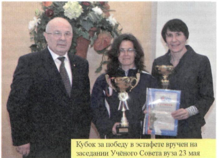
Кубок за победу в эстафете вручен на заседании Учёного Совета вуза 23 мая