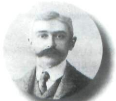
150 лет со дня рождения Пьера де Кубертена