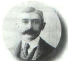
150 лет со дня рождения Пьера де Кубертена