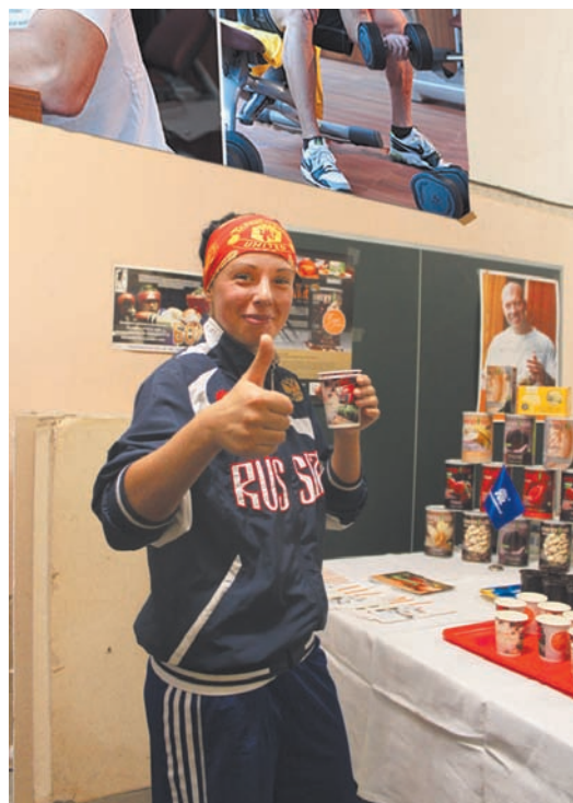
Дегустация функционального питания Energy Diet HD.