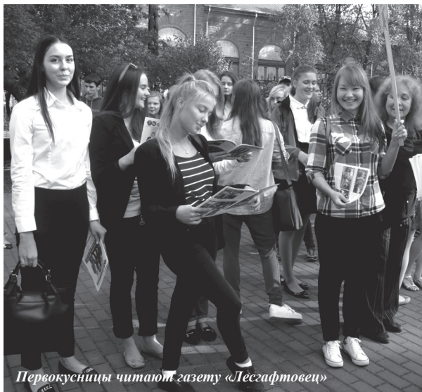
Первокурсницы читают газету «Лесгафтовец»

Выпускники школ, тем более, студенты должны владеть и «визуальной» грамотностью - способностью понимать географические карты, таблицы, фотографии, видео, ведь формат «мультимедиа», где данные представ-