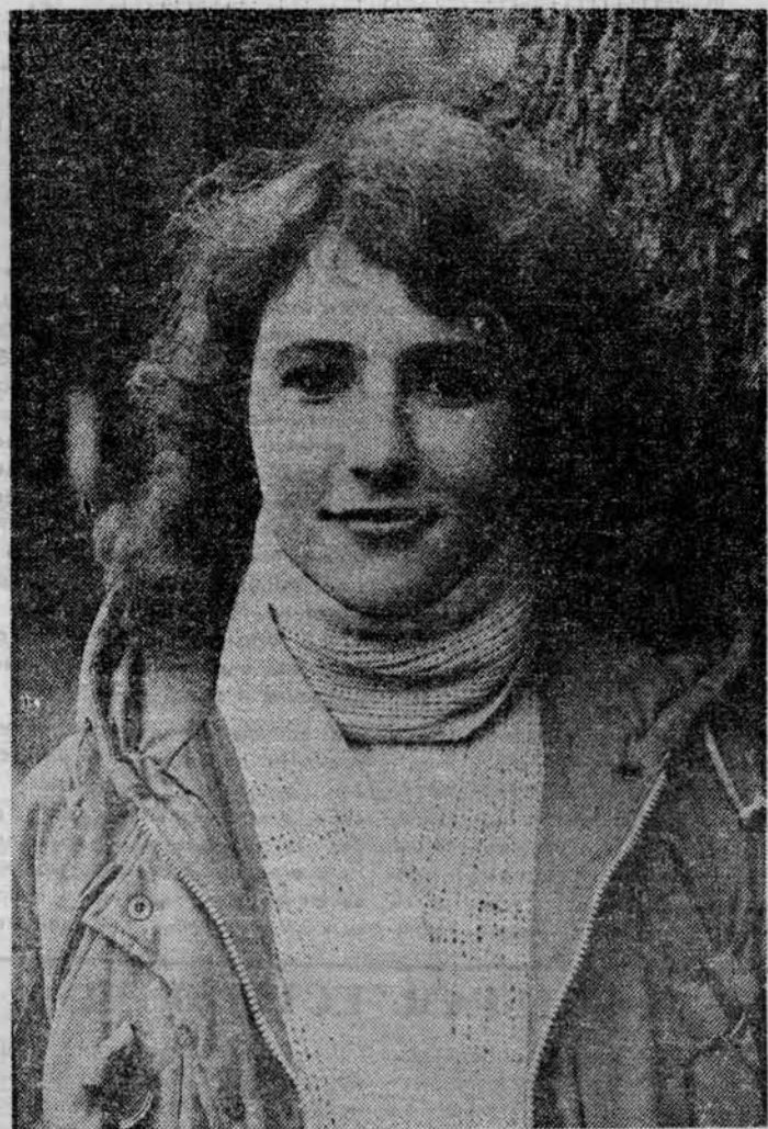
Есть у нас в группе...

№ 9—10 [1353—1354] ● Среда, 8 марта 1989 г. ● Газета издаётся с 1940 года ● Цена 2 коп.