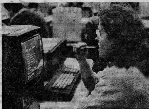
Немало полезного получают здесь для предстоящей самостоятельной работы наши студенты.