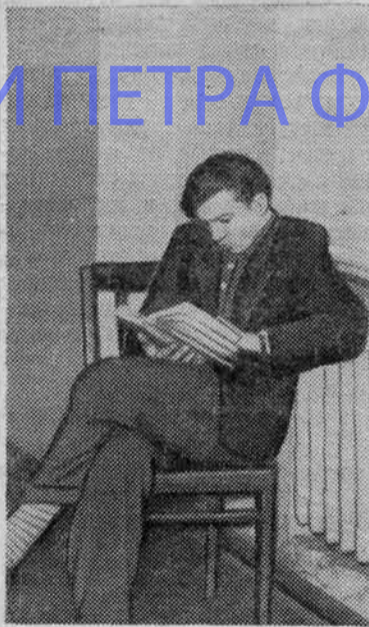
Последний неразрешенный вопрос.