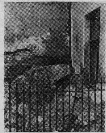
«Чудесный» вид открывается из окон кафедры анатомии.

В институте начинается «Месячник здоровья», который явится и своеобразным походом за