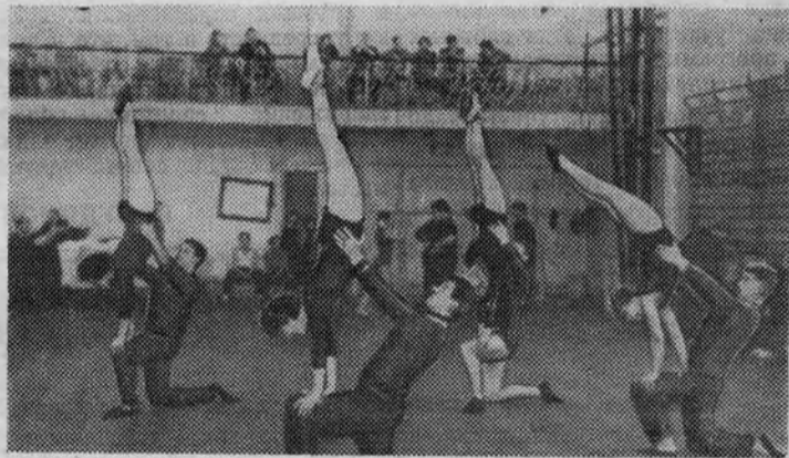
НА СНИМКЕ: отрабатывается каждое движение.