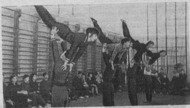
НА СНИМКЕ: момент репетиции выступления.

КАК не гордиться всем нам вместе и каждому в отдельности всемирно-историческими успехами нашей Родины! Коммунистическая партия, пользуясь компасом марксистско-ленинского учения, уверенно ведет советский корабль сквозь все бури и препятствия к желанным берегам коммунизма. Как не испытывать огромного внутреннего удовлетворения, сознавая, что в общих победах есть и твоя доля, что не гостем, а полноправным хозяином шагаешь ты, гражданин Советского Союза, по жизни, и все, что видишь кругом, и все, что будет сделано, — это для тебя, для твоих детей, для всех нас, для советского общества — общества строителей коммунизма, для нашей Родины!