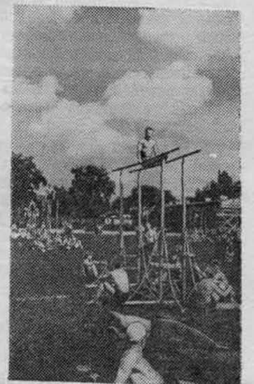
На снимке: момент репетиции.