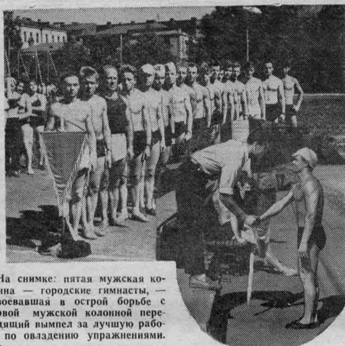
На снимке: пятая мужская колонна — городские гимнасты, — завоевавшая в острой борьбе с первой мужской колонной переходящий вымпел за лучшую работу по овладению упражнениями.