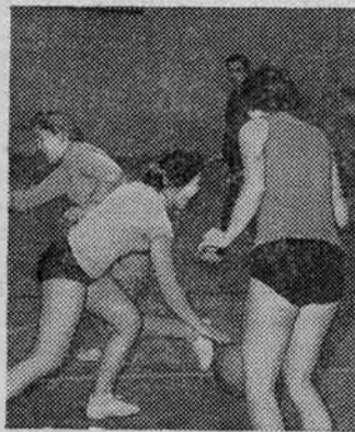
Первокурсники на занятиях по баскетболу.