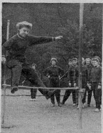
Первокурсники занимаются легкой атлетикой на институтском стадионе.

Сотрудники кафедры гимнастики немецкого института физической культуры. Лейпциг».