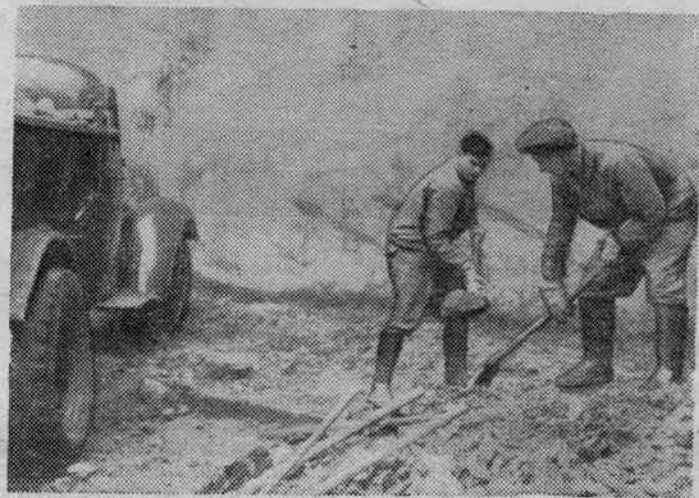
НА СНИМКЕ: первокурсники на хозяйственных работах во дворе института.

Подписную плату надлежит сдавать в редакцию (каф. гигиены, 3-й этаж главного учебного корпуса, комната 301).