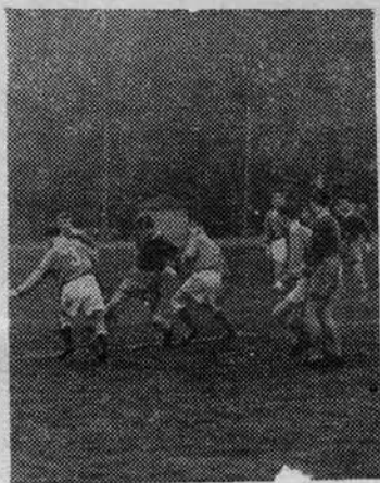
На снимке: момент игры.