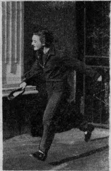
студентка — выпускница Федоткина несетя во всю прыть. Чтобы выйти на десять минут раньше!