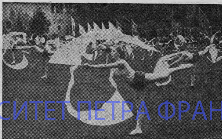
На снимках: вверху — парад участников выступления; внизу — девушки выполняют упражнения с вымпелами.