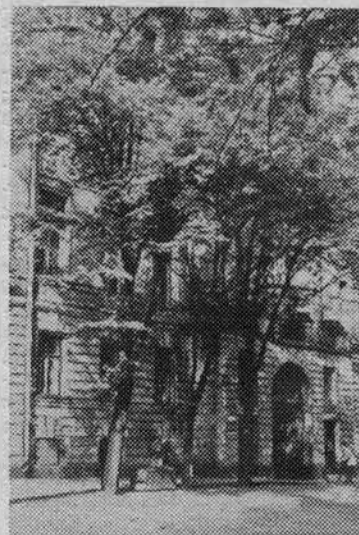
Здание техникума физкультуры, переданное институту.