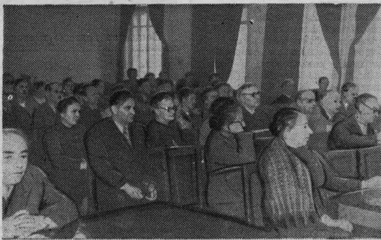
Начался новый учебный год в сети партийного просвещения. На снимке: в аудитории 419 идет первая лекция.

Формы и содержание политической учебы преподавателей будут отвечать профилю научной работы, проводимой сотрудниками кафедр, будут способствовать углубленному пониманию ими научно-теоретических проблем. Так, кафедра теории физического воспитания намеревается работать над темой «Ленинская теория познания и ее отражение в теории физического воспитания», кафедра физиологии — над темой «Диалектическое раз-