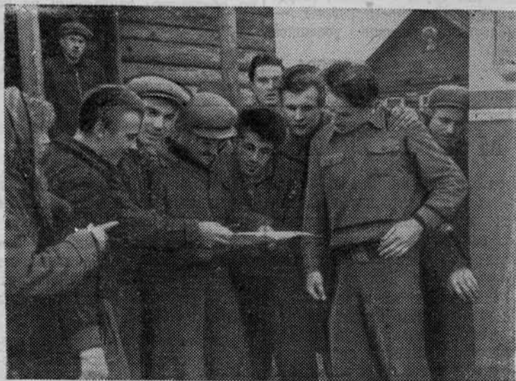
Получен свежий номер институтской газеты. Студенты педфака, находящиеся на уборочных работах в колхозе «Красная заря», с удовлетворением отмечают: «И про нас есть!»