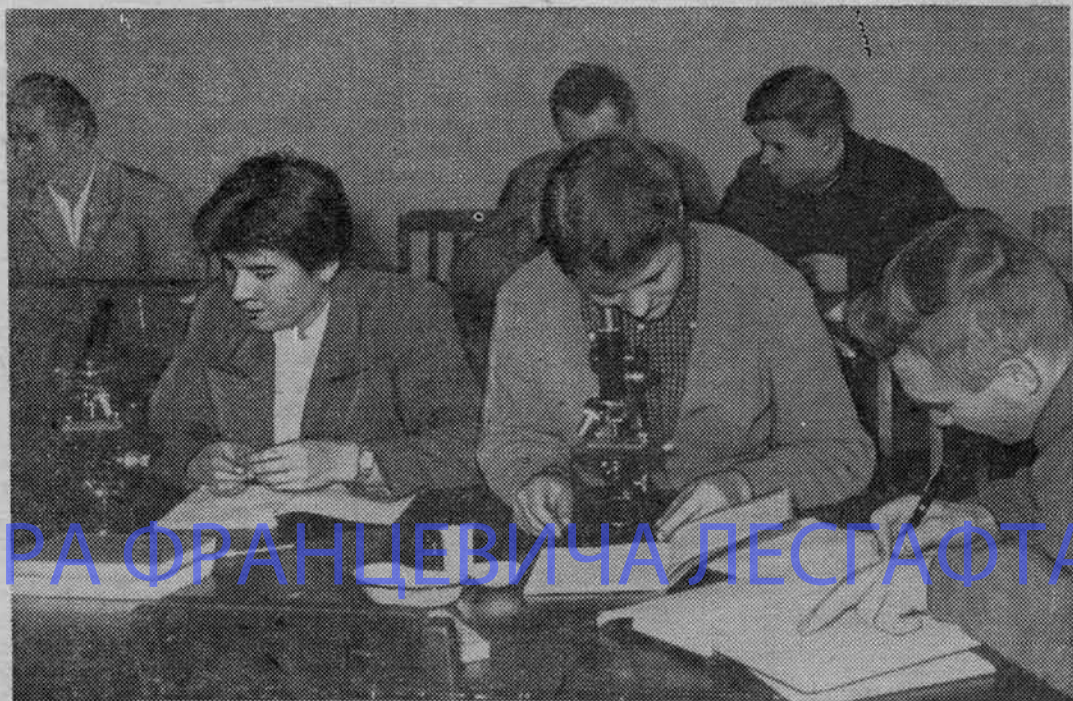
На снимке: 3-я группа II курса спортфака на практических занятиях по физиологии.