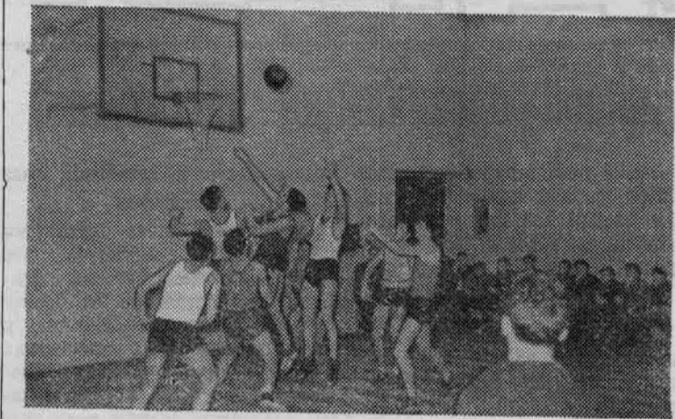
На снимке: одна из игр на первенство института по баскетболу.

К сожалению, в институтах физической культуры планируют и организуют спортивное совершенствование, пренебрегая этим единством. Планирование спортивной подготовки осуществляется по всем указанным выше направлениям разрозненно: и учебной частью, и кафедрами, и спортивным клубом, и другими инстанциями. Это ведет к совпадению в один день нескольких видов занятий, к переутомлению студентов или к длительным перерывам в тренировке.