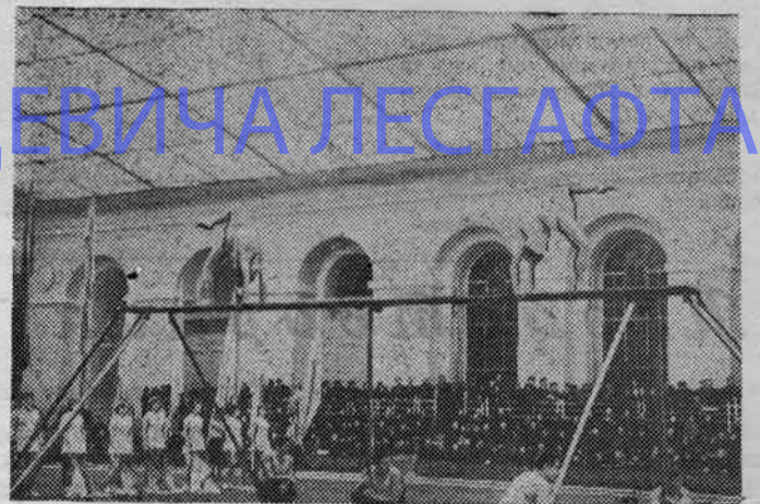
НА СНИМКЕ: момент выступления наших гимнасток на празднике открытия Зимнего стадиона.