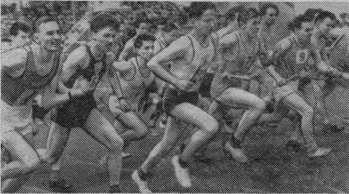
На снимке: старт взят.

Спорсмены института физкультуры имени Лесгафта всегда славились своей сплоченностью, умением бороться до конца, до победы. Наиболее ярко это проявляется всякий раз в традицион-