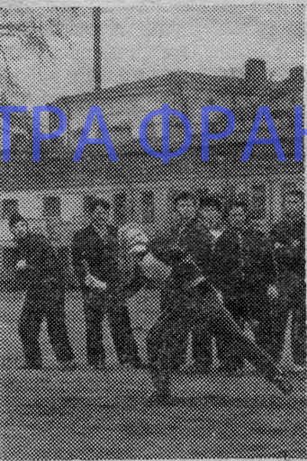
На снимке: момент соревнования по гранатометанию.