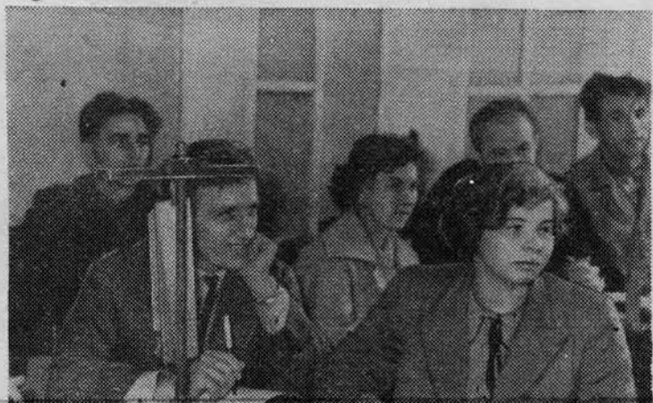
НА СНИМКЕ: лабораторные занятия по гигиене у заочников.

Помощь таким спортсменам в учебе должна заключаться в своевременной консультации и организованном направлении их учебной работы. В. БЕЛУРОВО