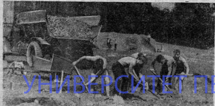
НА СНИМКЕ: группа студентов работает на строительстве стадиона.