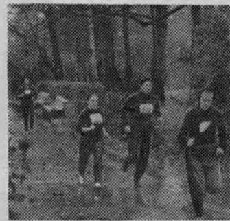
На снимке: на трассе кросса группа I курса ШТ. Среди курсовых команд победа досталась I курсу ШТ. Места факультетов распределились следующим образом: школа тренеров, спортфак, педфак.

Небольшой, но дружный коллектив школы тренеров сумел неплохо подготовиться и обеспечить высокую явку участников. Среди учебных групп сильнейшей оказалась 4-я