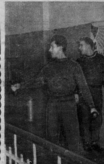
У них, наверное, сил не хватает, чтобы на улицу выйти.