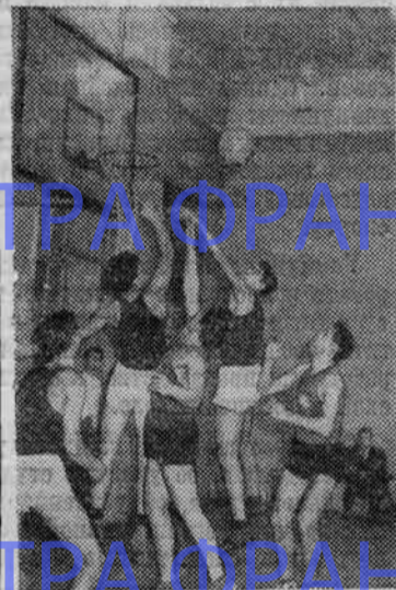
Момент игры первой команды СКИФА с командой Политехнического института. Встреча закончилась победой наших баскетболистов.