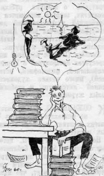
Рис. В. Макушенко