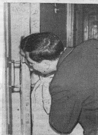
На нижнем снимке: интересно, как отвечают товарищи?