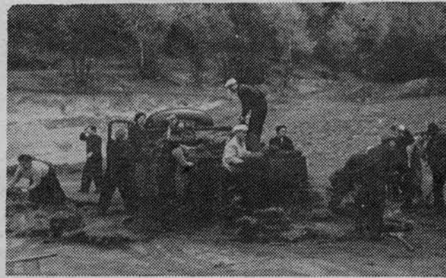
На снимке: погрузка дерна на грузовик.