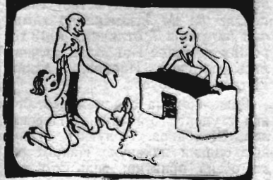
Рис. студента М. Яковлева