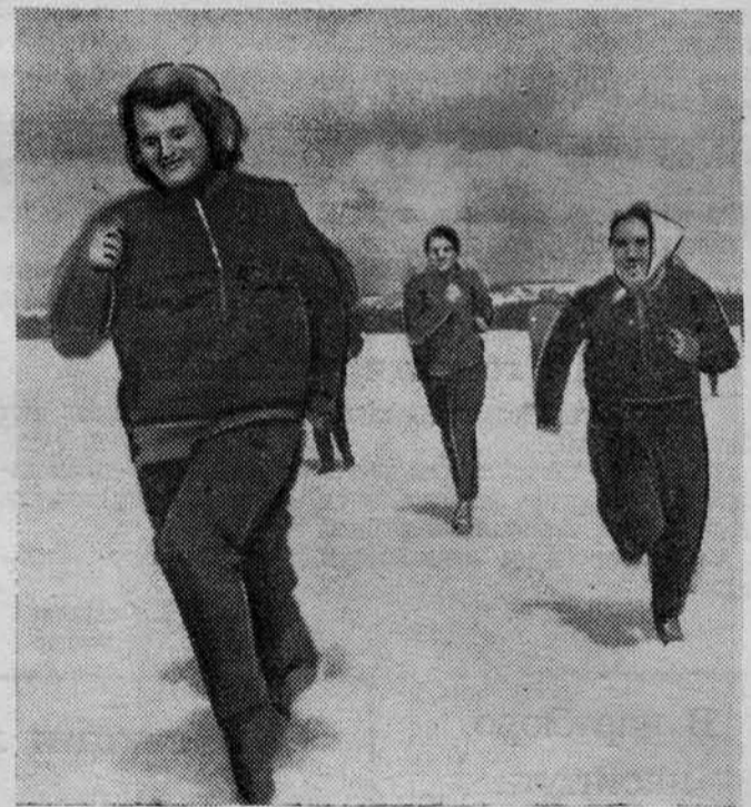
На снимке: легкоатлеты на тренировке.