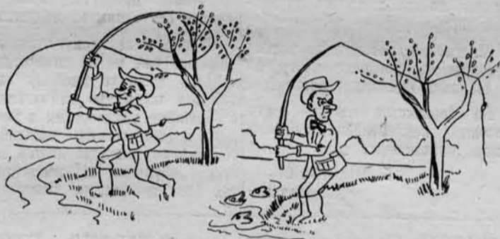
Рис. Р. Хачатурова