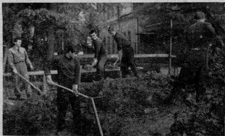
На строительстве спортивного манежа.

— Это движение идет так... Ясно, какова динамика?! Рис. студента. А. Синюрина